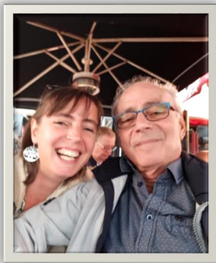
Sanneke en haar vader