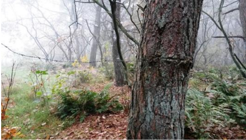
Boom met ingegroeid prikkeldraad