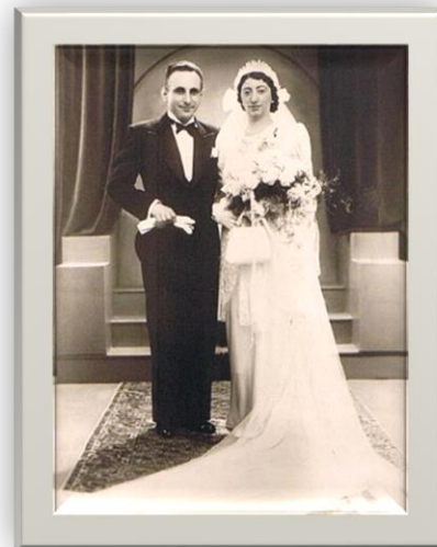
opa en oma