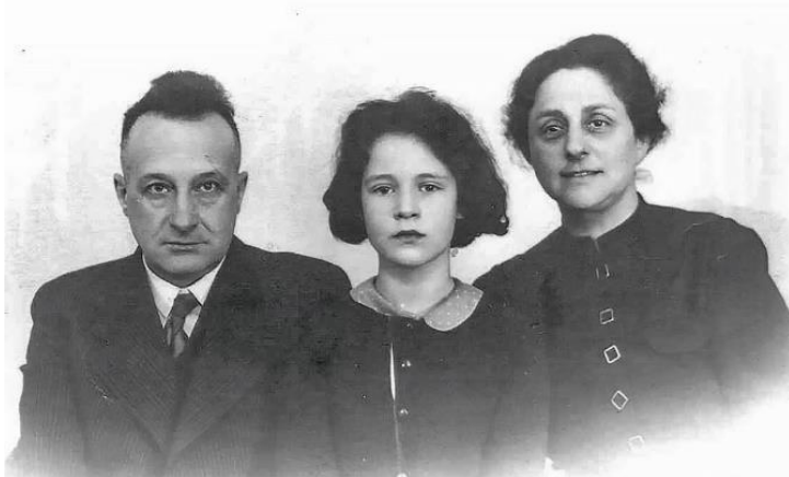
Opa – moeder – oma